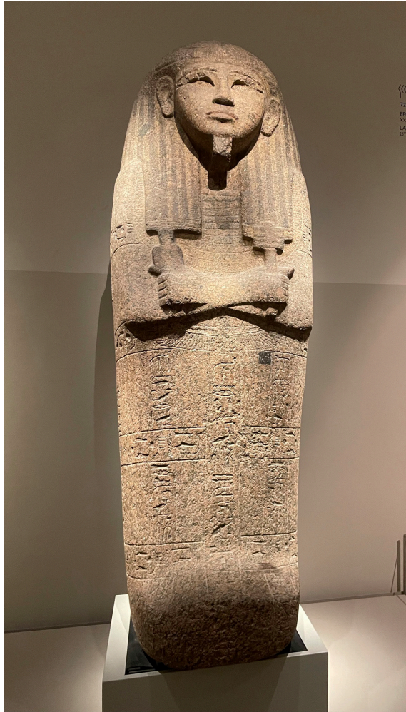
Gammal italienare från Egypten.

22 november, förmöte hos notarien för att kontrollera vår italienska språknivå.