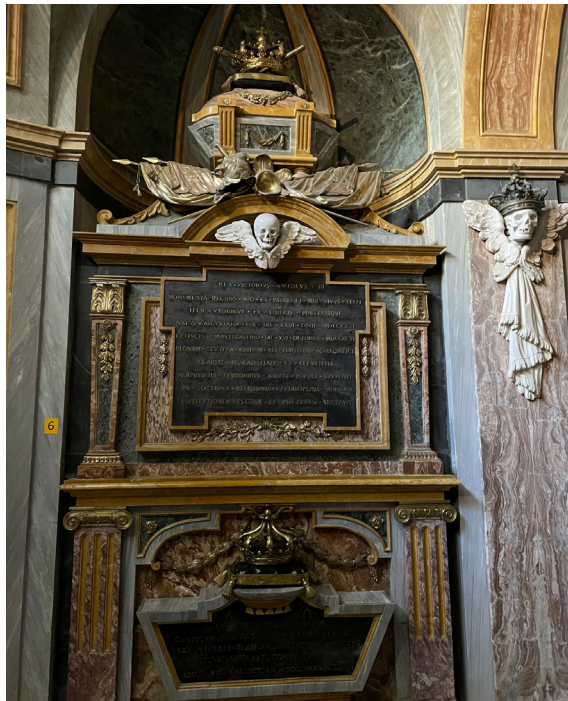
En död italiensk kung.