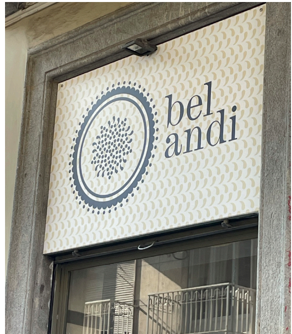
Lunch hos Mase i Torino.