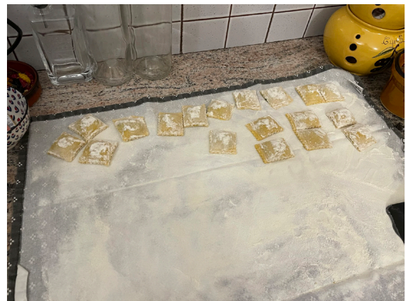
Ravioli enligt traditionen.