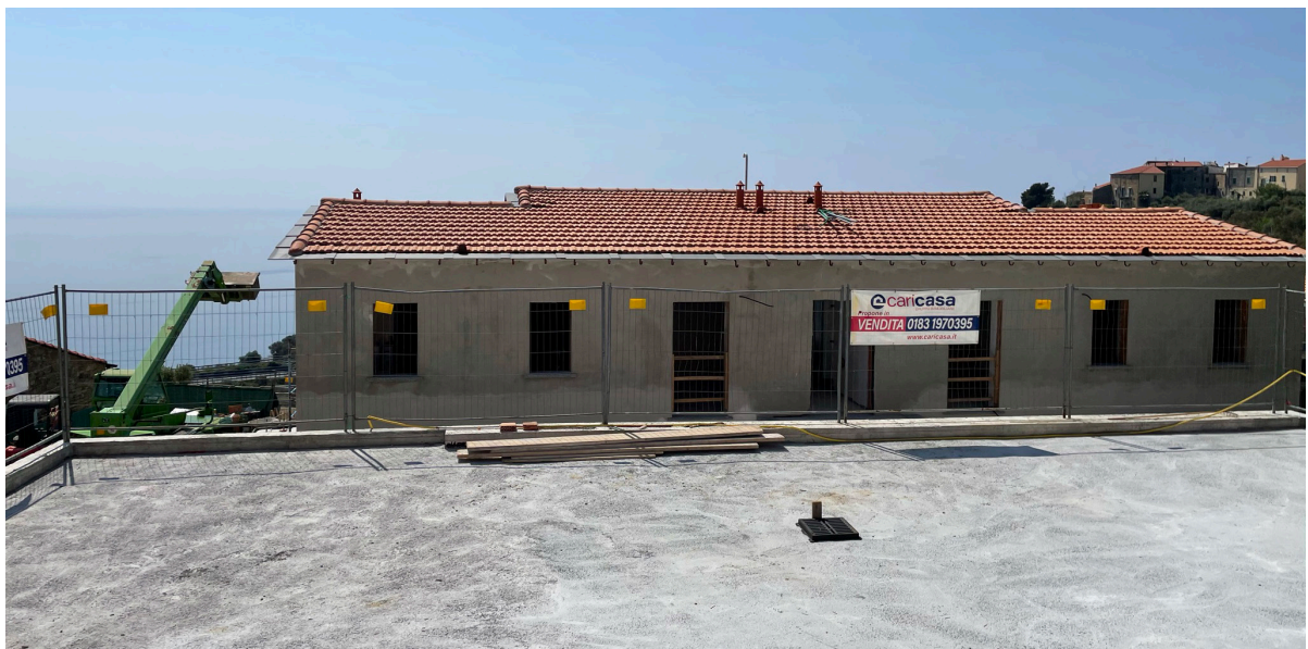
Nya lägenheten i Cipressa.

15 april, tittade på en lägenhet i Cipressa vid kommunhuset.