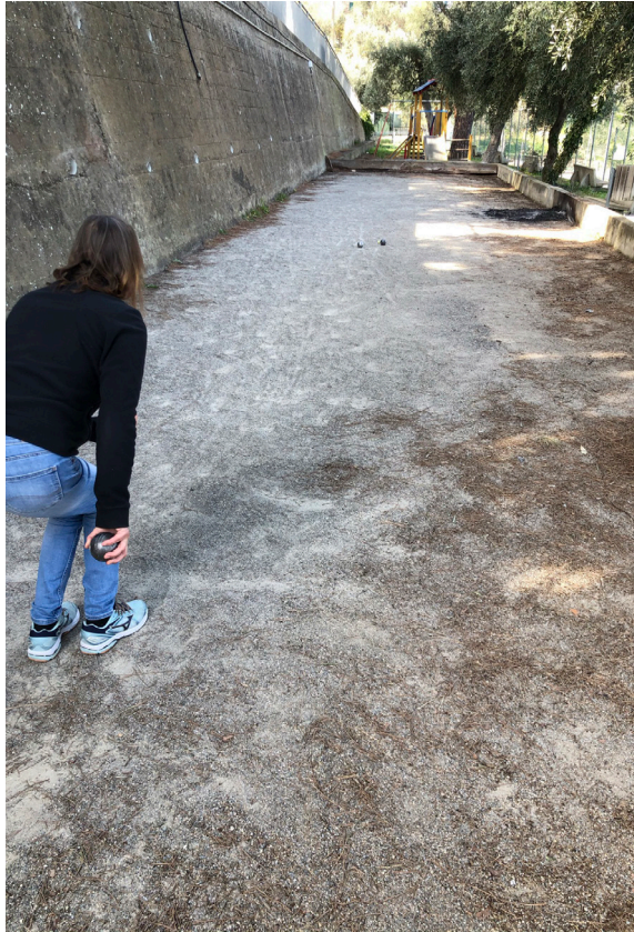
Petanque/Boule i Costarainera.