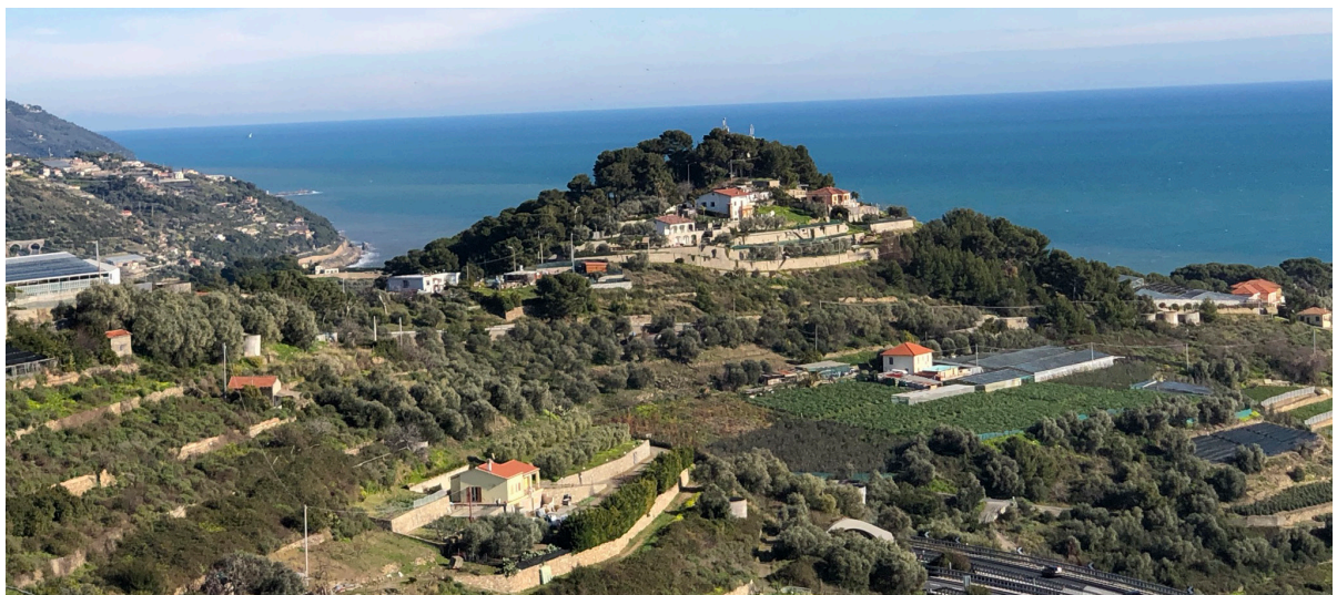
Utsikt från Costarainera/Cipressa.

14 februari, börjar packa för flytt från Nice.