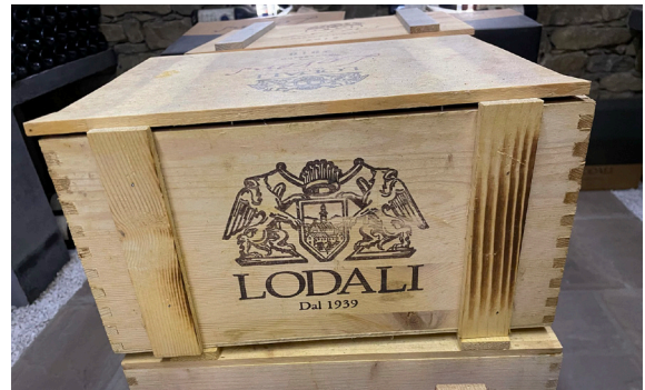
Vin i Piemonte.